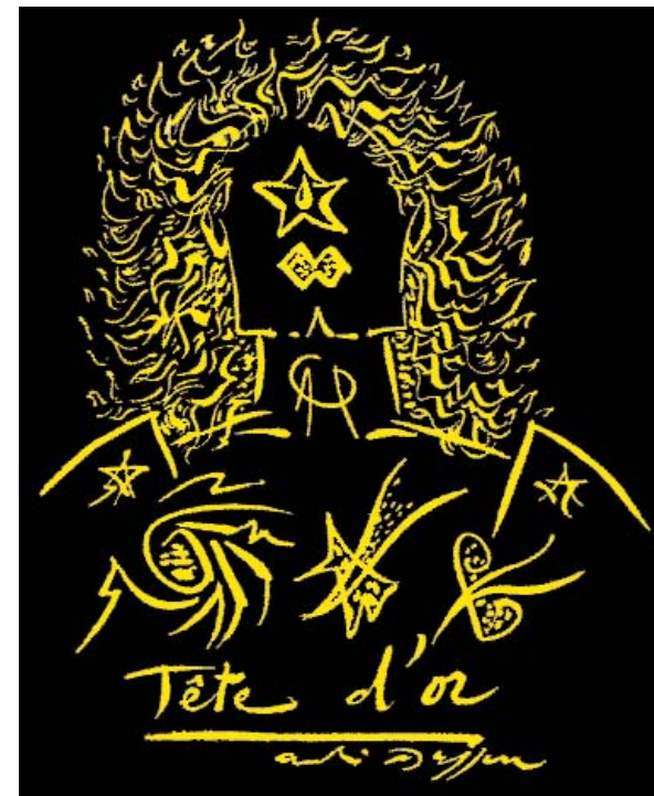
Tête d'Or , dessin original d'André Masson pour le n° 27 des Cahiers Renaud-Barrault Ed. Julliard